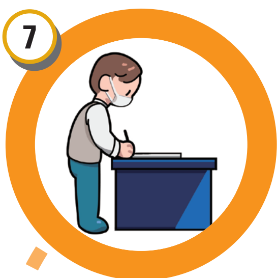
응시원서 내용 확인 후 사진부착 및 날인(서명)