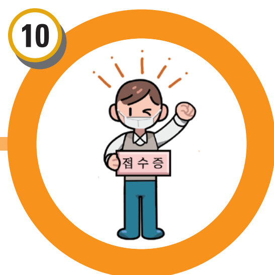
접수증 수령 (접수 완료)