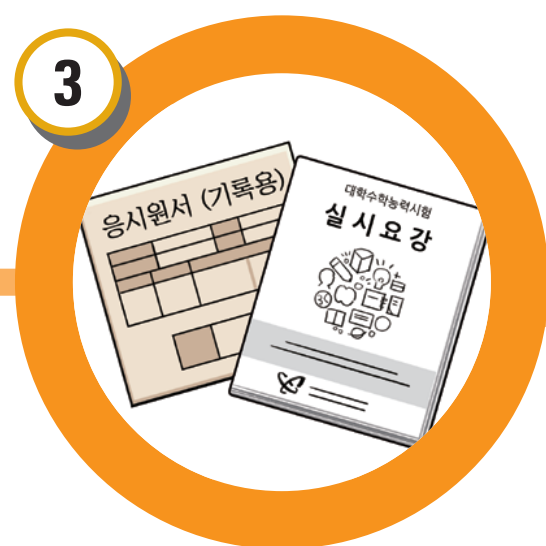
응시원서 기초자료, 실시요강 수령