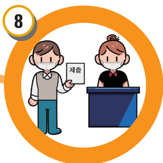
응시원서 제출 및 응시수수료 납부 (필요시 증빙서류 첨부)