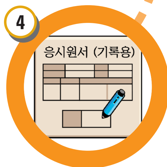
응시원서 기초자료 작성 및 제출