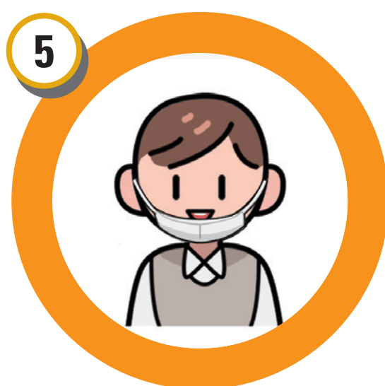
본인 확인(신분증, 부착용 사진 확인을 위하여 마스크는 잠깐 내리기)