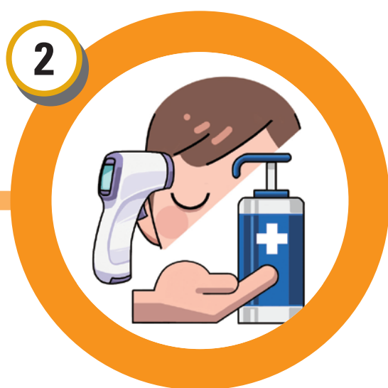
발열체크와 손소독 하기