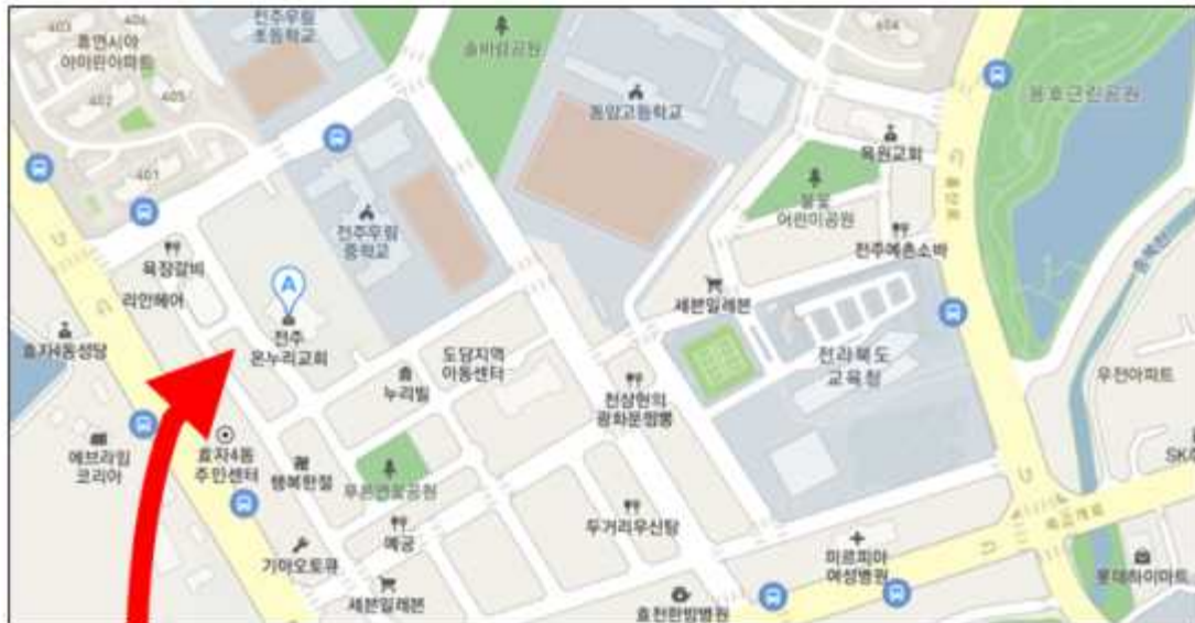
전주 온누리교회 주차장