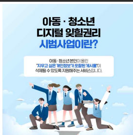
서비스 소개 (개인정보위 SNS)