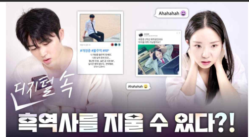
실제 이용사례 홍보영상 (개인정보위 유튜브)