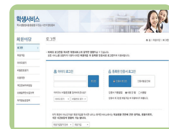
로그인 (ID/PW) 및 서비스이용