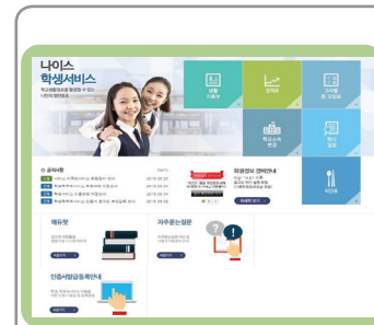
나이스 학생 서비스 선택