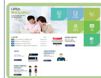
나이스 학부모 서비스 선택