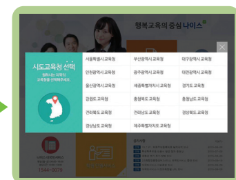
소속 교육청 선택