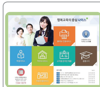
나이스 대국민서비스 접속 (www.neis.go.kr)