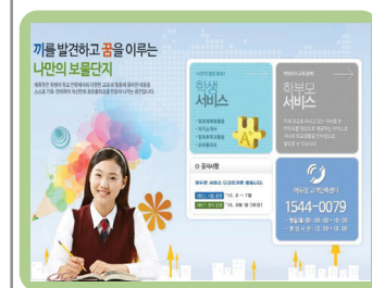
에듀팟 홈페이지 접속 (www.edupot.go.kr)