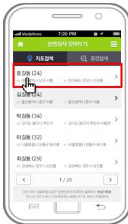
④ 성범죄자 확인