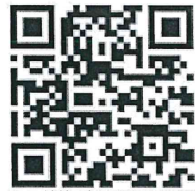
신청 접수 QR코드