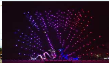
⑨ 지평선 판타지쇼&드론쇼