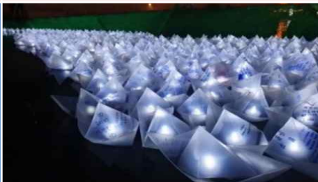
⑪ LED 소원배 띄우기