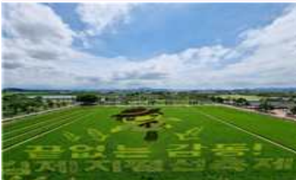
④ 지평선 대지아트