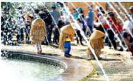
⑦ 도롱이 워터터널