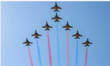
⑩ 블랙이글스 '에어쇼'