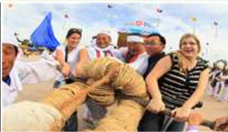
② 풍년기원 입석줄다리기