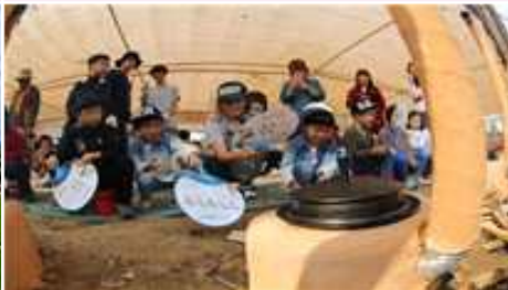
⑤ 아궁이 쌀밥짓기 체험