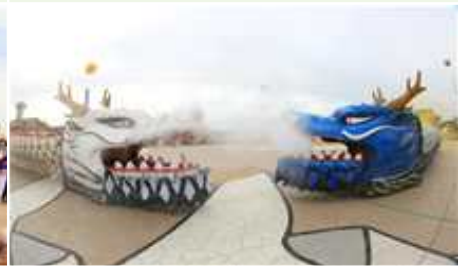
③ 벽골제 쌍룡놀이