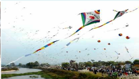
⑧ 지평선 연날리기