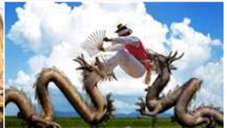
⑥ 지평선 줄타기