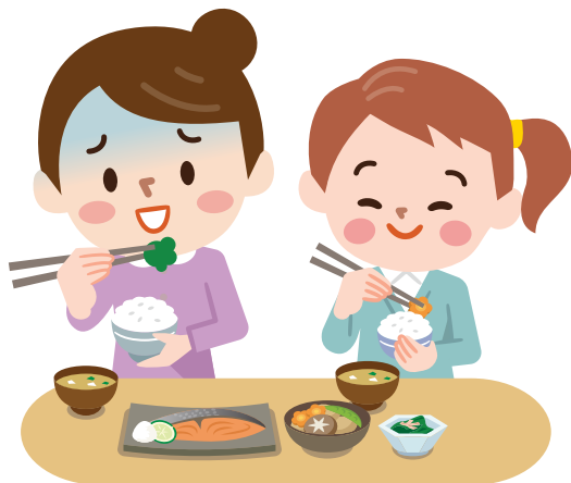
감염자와 함께 식사