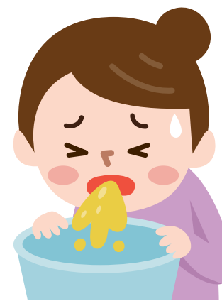
감염자의 분변이나 구토물