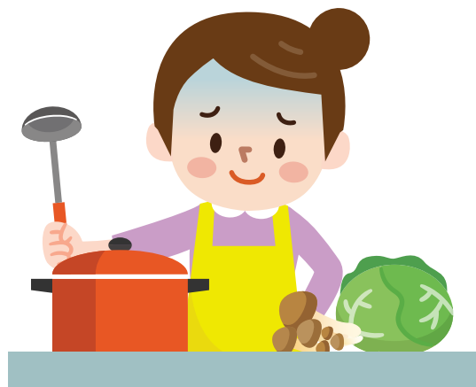
감염자가 만든 음식