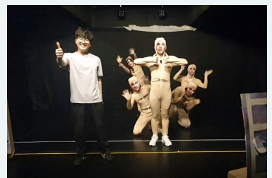
고등부문 대상 (TenFingers)