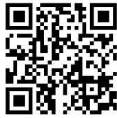
YIP (청소년 발명가 프로그램)