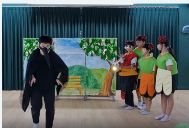
초등부문 대상 (잠자리 특공대)