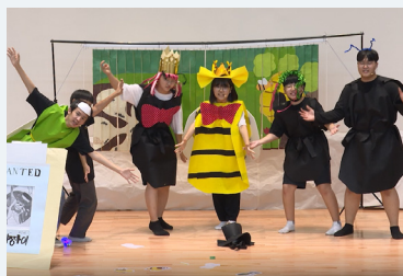
중등부문 대상 (ESCaper)