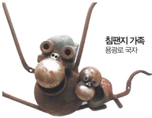
침팬지 가족 용광로 국자