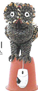
올빼미 단추, 마우스