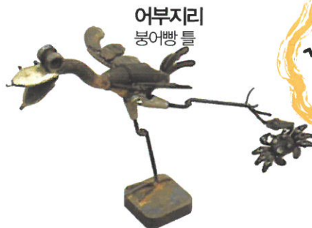
어부지리 붕어빵 틀