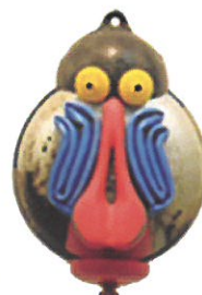
만도린 원숭이 금속, 자전거 안장