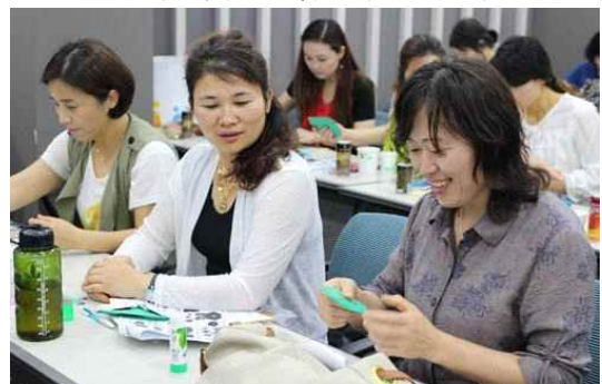
‘교육전문가 수업 지도법’ 연수