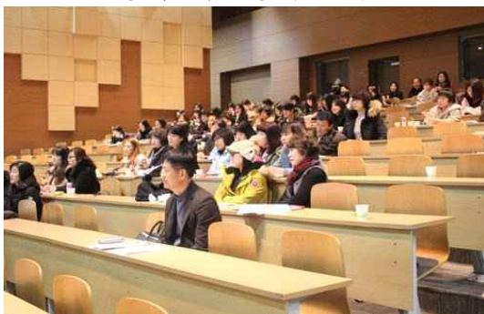
‘지도방법 및 학생관리’ 연수