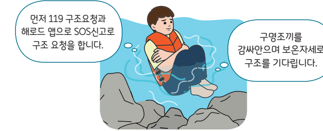
< 구조 전까지 체온유지(보온) 자세 >