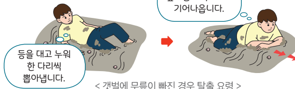
< 갯벌에 무릎이 빠진 경우 탈출 요령 >