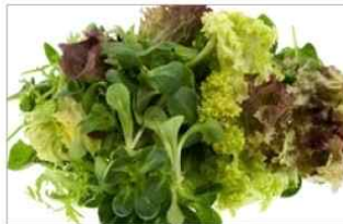
시금치, 상추 등 생채소, 새싹채소 및 샐러드, 과일