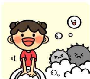
흐르는 물과 비누로 손을 자주 씻어요!