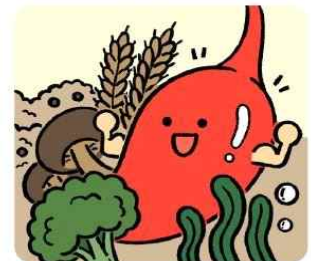
신선한 채소, 해조류로 위장을 튼튼하게 해요!