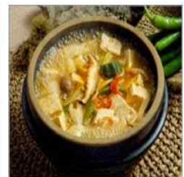
무더운 여름에는 가열(75℃ 이상)식품 위주로 섭취