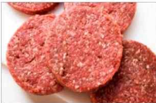
쇠고기(특히 간 쇠고기, 햄버거) 및 쇠고기 육제품(햄, 소시지)