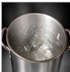
조리도구 열탕소독 또는 염소소독 실시