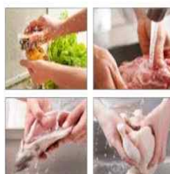
채소류→육류→어패류 →가금류 순으로 세척