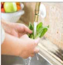
흐르는 물에 3회 이상 세척