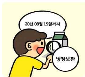
식품의 유통기한과 바른 보관 방법을 확인해요!