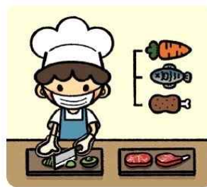
식재료에 따라 조리기구를 구분하여 사용해요!