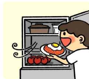
바로 먹지 않는 음식은 냉장고에 보관해요!