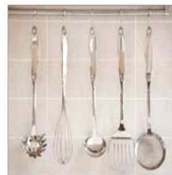
용도별 조리도구 구분 사용