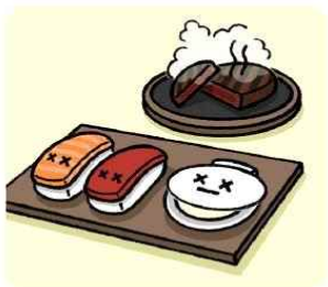
생선회나 조개 등 날음식은 피하고 꼭 익혀서 먹어요!