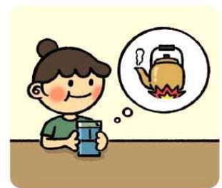
물은 반드시 끓여서 마시도록 해요!