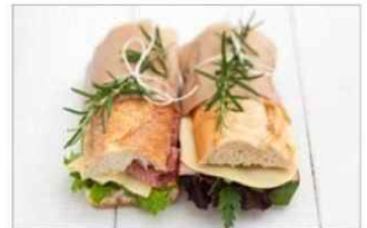
보균자에 의해 조리된 식품 (도시락, 샌드위치)