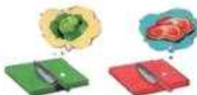
칼, 도마 용도별 구분사용