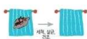
행주는 세척, 살균, 건조 사용 및 용도로 구분