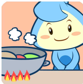
음식물은 익혀서 먹기