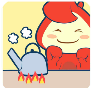
물은 끓여서 마시기