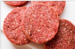
쇠고기(특히 간 쇠고기, 햄버거) 및 쇠고기 육제품(햄, 소시지)