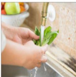
흐르는 물에 3회 이상 세척