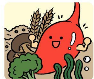
신선한 채소, 해조류로 위장을 튼튼하게 해요!