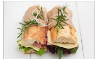
보균자에 의해 조리된 식품 (도시락, 샌드위치)