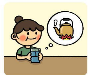
물은 반드시 끓여서 마시도록 해요!