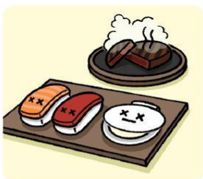
생선회나 조개 등 날음식은 피하고 꼭 익혀서 먹어요!