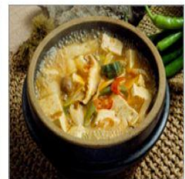
무더운 여름에는 가열(75℃ 이상)식품 위주로 섭취