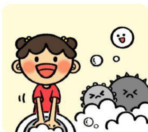
흐르는 물과 비누로 손을 자주 씻어요!