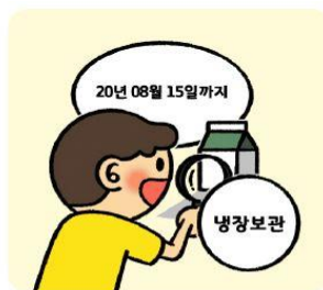
식품의 유통기한과 바른 보관 방법을 확인해요!