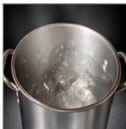
조리도구 열탕소독 또는 염소소독 실시