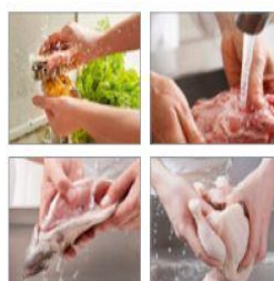
채소류→육류→어패류 →가금류 순으로 세척