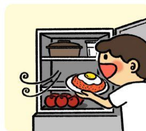
바로 먹지 않는 음식은 냉장고에 보관해요!