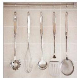
용도별 조리도구 구분 사용