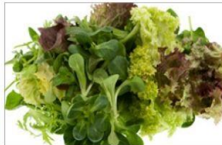
시금치, 상추 등 생채소, 새싹채소 및 샐러드, 과일