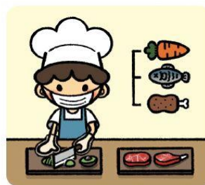
식재료에 따라 조리기구를 구분하여 사용해요!