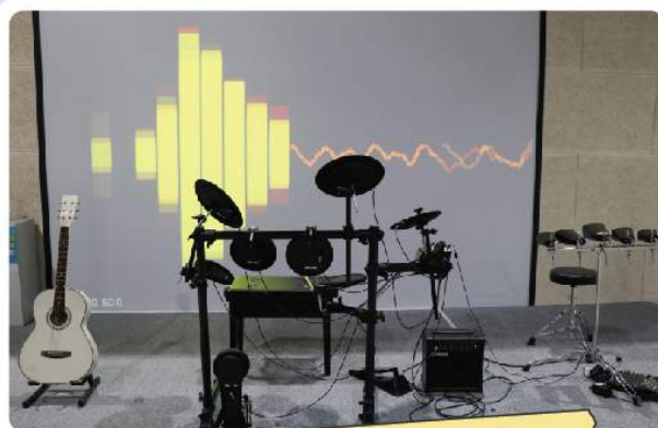
소리가 만드는 예술