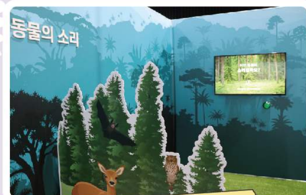
자연을 담은 소리