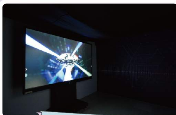
신나는 소리 탐험