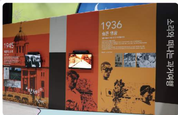
소리, 역사를 담다