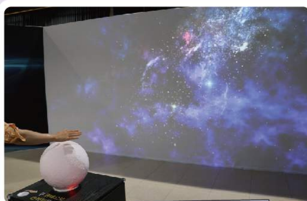
소리, 미래를 열다