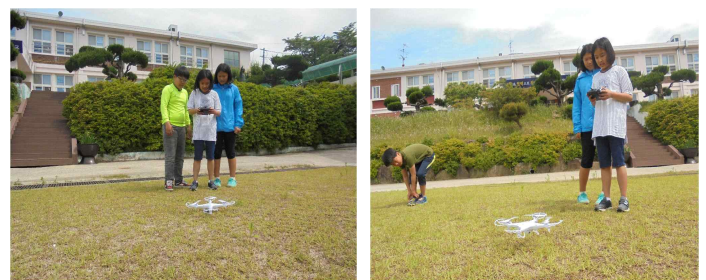
< 5학년 SIE-LAY 드론날리기 활동 >