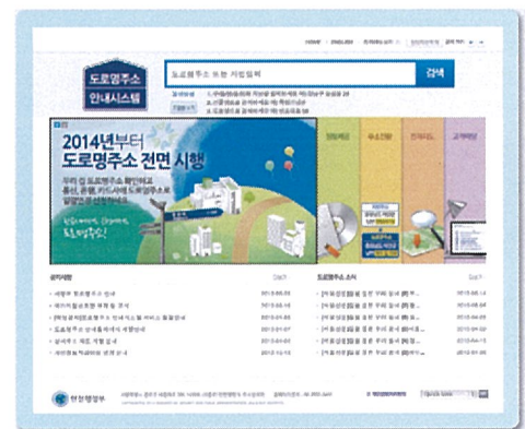
〈 도로명주소 홈페이지 www.juso.go.kr 〉

» 포털사이트에서! • 인터넷 검색 창에 지번주소를 입력하면 도로명주소를 쉽게 확인할 수 있습니다.