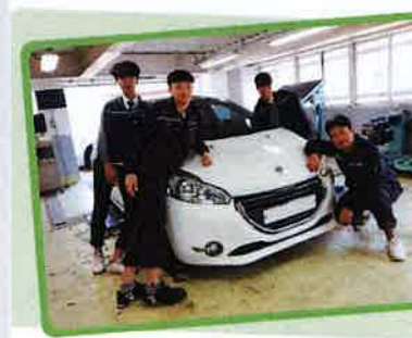
수입자동차 동아리반 운영

측정기구 및 손작업 사용법, 기계기구 작동법, 전기용접, 특수용접 등 필요한 기초 기능을 기른다.