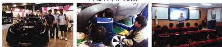
자동차 모터쇼 견학(KINTEX)