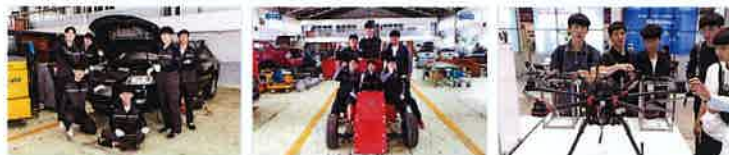
자동차 정비동아리 운영