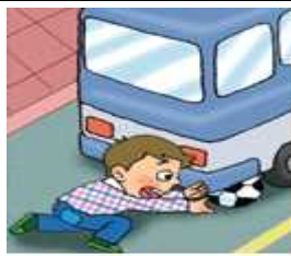
차 밑에서 공(물건)을 빼고 있는 아이