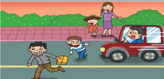
무단횡단을 하는 어른을 보고 따라하는 경우