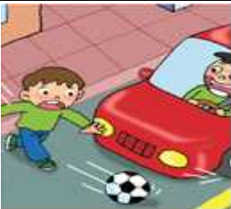
차도로 굴러가는 공을 쫓아가는 아이