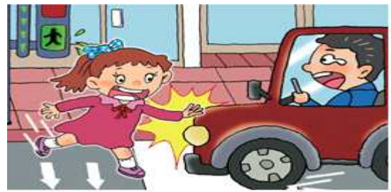
초록불이 들어오자마자 갑자기 뛰어드는 경우