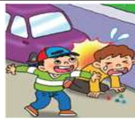
차 뒤에서 놀고 있는 아이