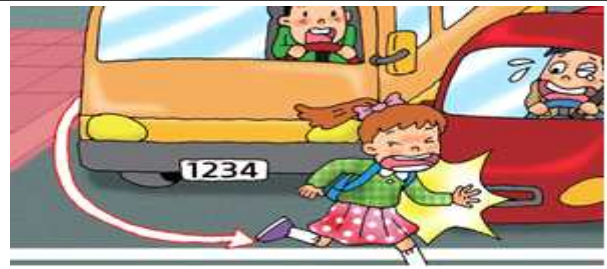
통학버스 또는 부모님 차량에서 내려 급하게 횡단보도를 건너가는 경우