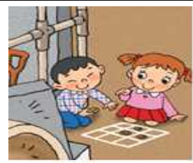
공사장 옆에서 놀고 있는 아이