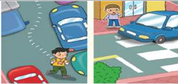
인도가 없는 이면도로를 지다가는 경우 횡단보도 앞에 주정차된 차 앞을 지나가는 경우