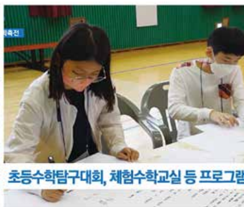
경남초등수학탐구대회 참가. 뉴스 보도자료