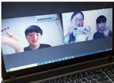
2021. 8. 첫 만남