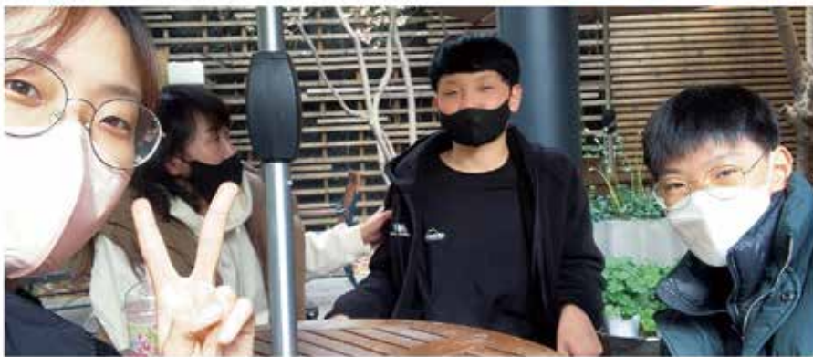
2021. 11. 성수동에서

얼마 전 두 아이는 위드 코로나 상황이 되면서 실제 만났다. 나와 사촌 동생과의 만남을 기대하며 선물을 준비해 온 ○○이와 그 가족의 정성스러움에 감동하며 즐겁게 지내고 다음 만남을 기약했다. 그 만남을 계기로 나는 어머니께 ○○이가 앞으로 세상을 경험하는 과정에서 아이가 온전히 이해받을 수 있는 공동체가 되어줄 것을 이야기했다.