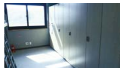
기숙사 호실 사물함