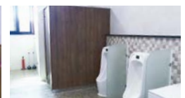
기숙사 공용 화장실