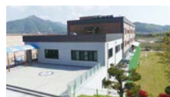
기숙사 건물 측면