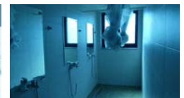
기숙사 공용 샤워실