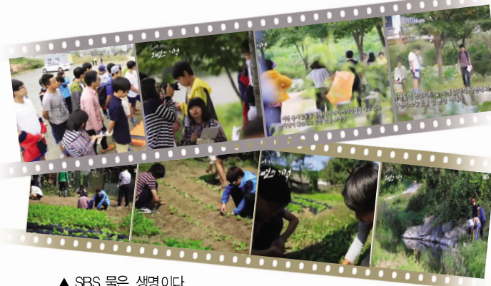
▲ SBS 물은 생명이다