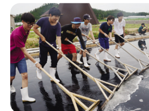
▲ 신안군 증도 염전 체험