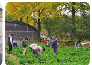
▲ 재배에서 수확까지