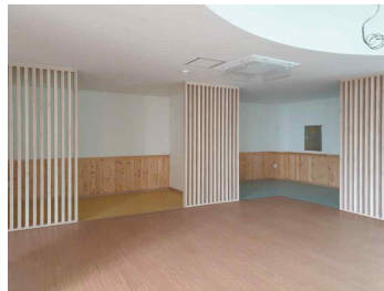
작은 실 1,2