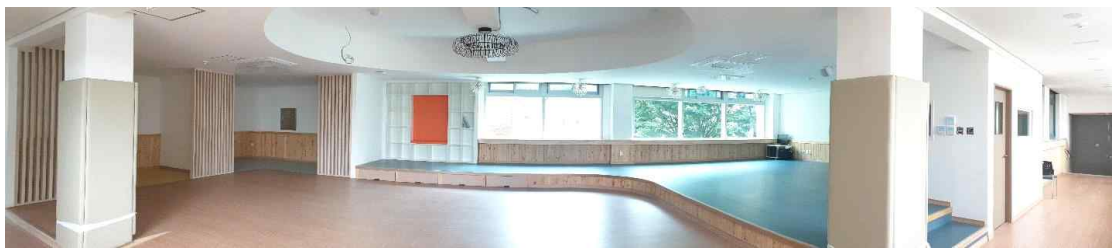
(구)시청각실 공간혁신 후 모습

중앙중학교 (구)시청각실이 공간혁신 사업을 통해 리모델링 되었습니다. 본 관과 후관 사이 2층 통로에 위치하고 있으며 학교 구성원들이 자유롭게 이용할 수 있는 공간입니다. 창가에 앉아 사색을 즐길 수도 있고, 무대에 앉아 담소를 나눌 수도 있으며 작은 실에서 쉴 수도 있습니다. 또한 협의회 등 소그룹 활동을 할 수 있는 공간으로 사용할 수 있습니다. 공간과 어울리는 가구 등은 구비해나갈 예정입니다. 현재 이름이 없어 공모를 통해 공간에 어울리는 멋진 이름을 정해보려고 합니다. 이름을 지어주세요!