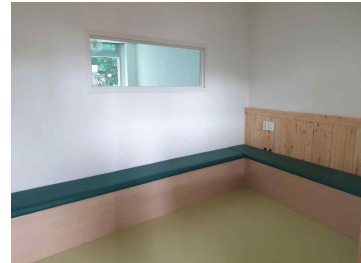
작은 실 3