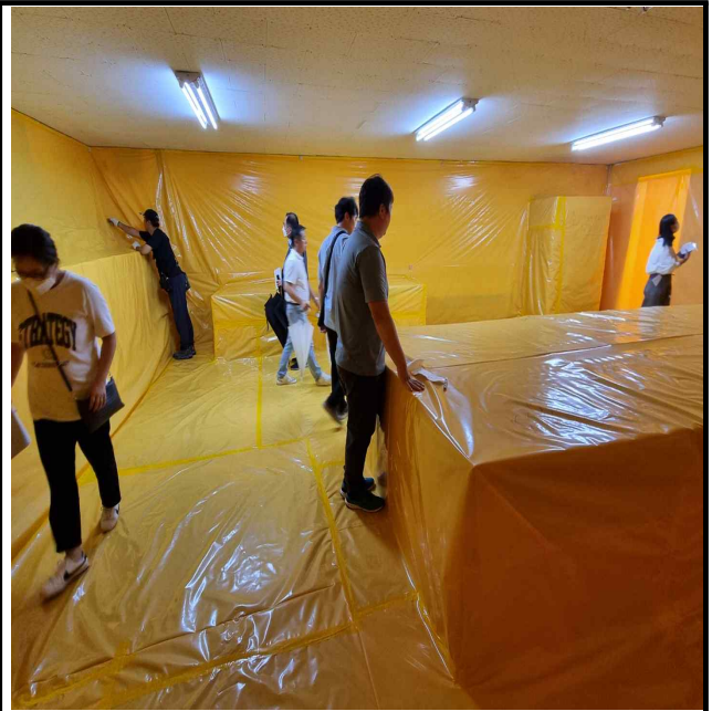
사진설명 : 비닐보양점검