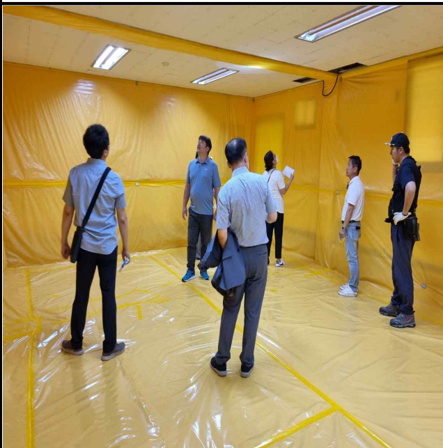
사진설명 : 비닐보양점검