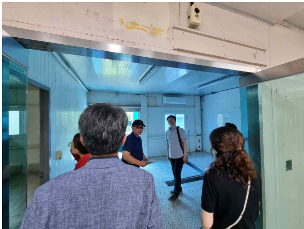
사진설명 : 사전청소점검