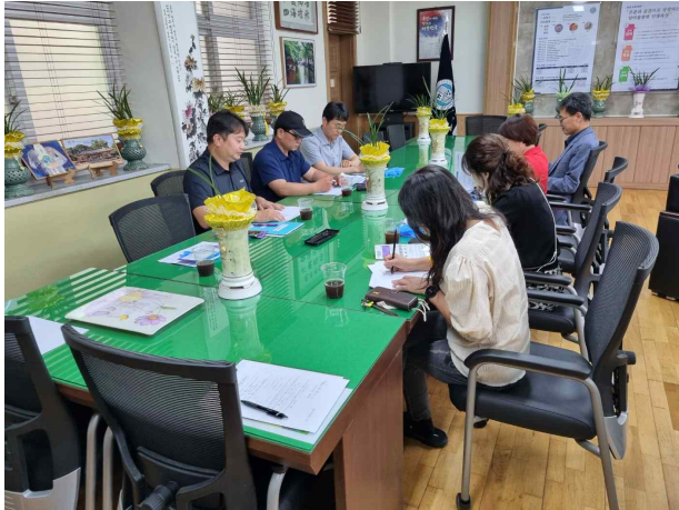
사진설명 : 사전설명회