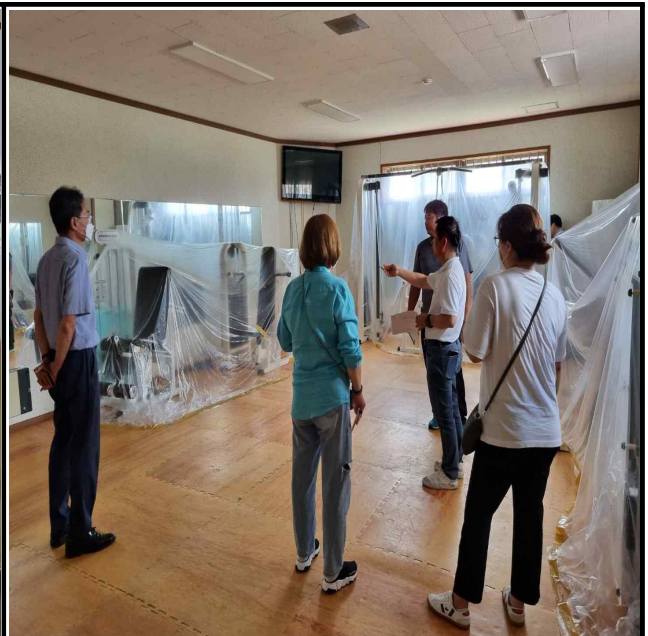
사진설명 : 사전청소점검