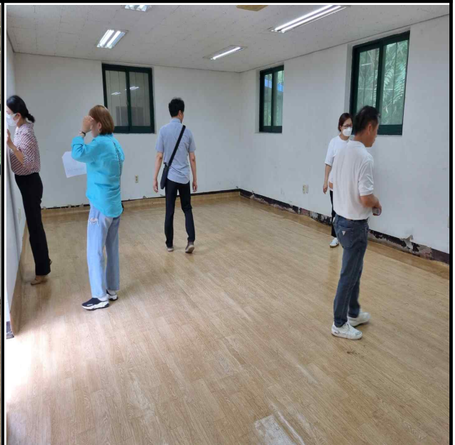
사진설명 : 사전청소점검