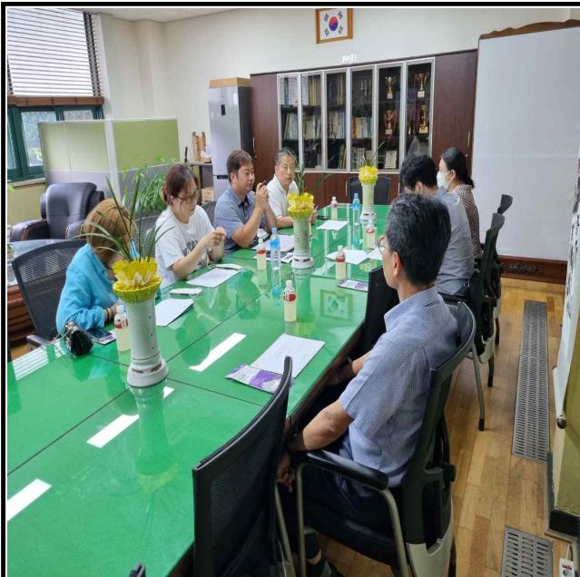
사진설명 : 사전설명회