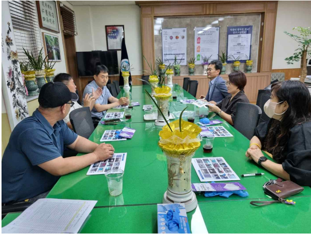
사진설명 : 3차점검 전 회의