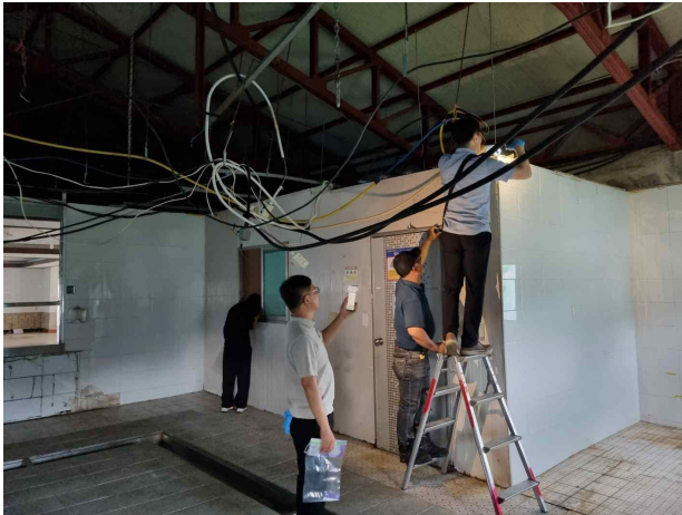
사진설명 : 잔재물 조사