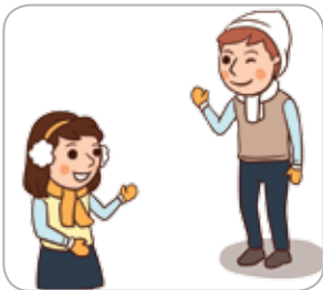
1 체온유지 용품(옷, 모자, 장갑, 신발 등)을 준비한다.