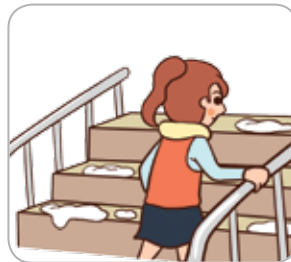
3 학교 현관 입구 또는 계단에서는 난간을 잡고 이동한다.