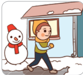
2 걸을 때 주머니에 손을 넣지 않는다.(낙상방지)