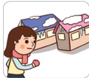
4 눈이 쌓인 지붕이나 고드름이 있는 곳은 접근하지 않는다.