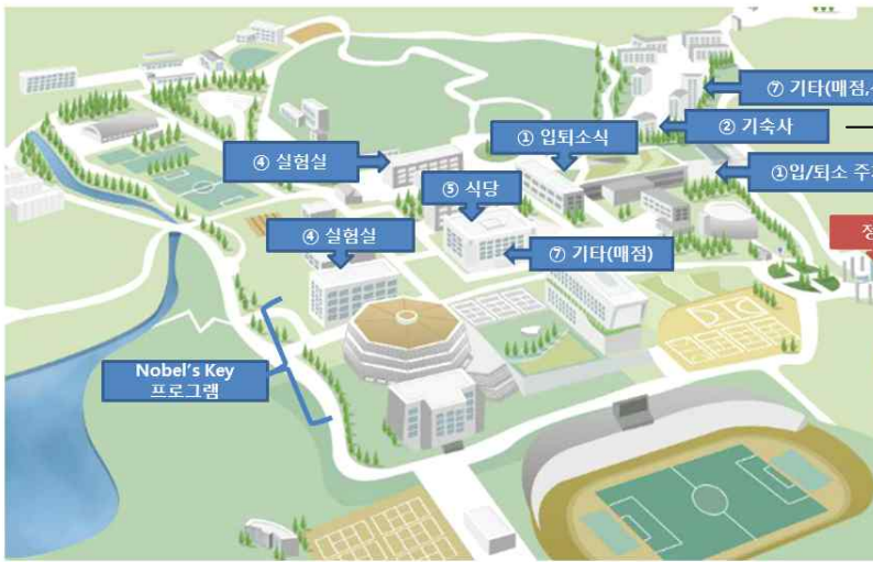
4동 기숙사 전경