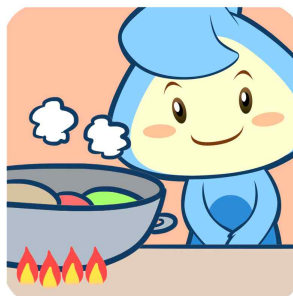
음식물은 익혀서 먹기