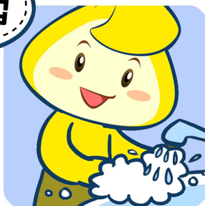
손은 비누로 깨끗이 씻기