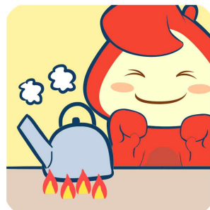
물은 끓여서 마시기