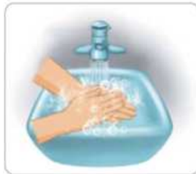
6 흐르는 물에 비누거품을 제거한다