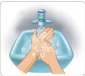
5 손톱을 세워 다른 손바닥에 마찰하듯이 닦는다