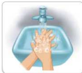
2 손바닥을 마주하고 깍지 껴서 닦는다