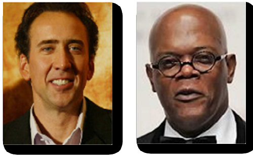
- 영화 '흑백소동' -

여러분이 영화감독이라고 가정해봅시다. 영화에 출연할 두 명의 배우를 캐스팅해야 하는데요, 한 명은 박사학위도 있고 세계적으로 유명한 작가상을 받은 사람 역할이고, 또 한 명은 도둑 역할입니다. 각각의 역할에 어떤 배우를 캐스팅 하고 싶나요?