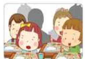
공공생활 구성원의 자질 함양

☆ 가정에서도 우리 아이들의 바른 식습관 형성을 위하여 많은 협조 부탁드립니다.