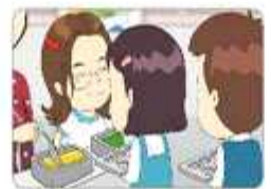
나눔과 배려, 공동체 의식 함양