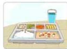
바른 식생활 습관 형성