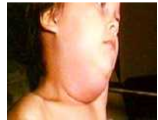
[유행성 이하선염 증상]