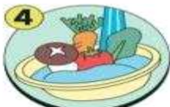
채소, 과일은 깨끗한 물에 충분히 씻어 먹기