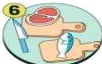
위생적으로 조리하기 * 닭, 도마 조리 후 소독 생선·고기·채소 등 도마 분리 사용