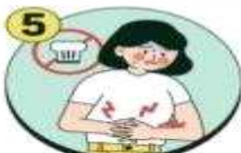
설사 증상이 있는 경우 음식 조리 및 준비 금지