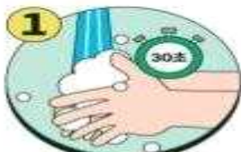
올바른 손씻기 생활화