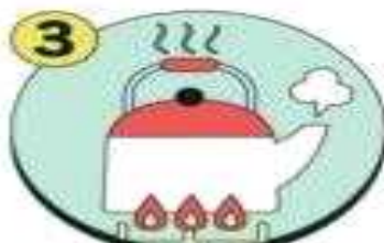
물은 끓여 마시기