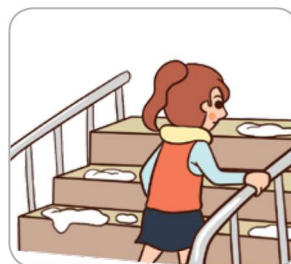
3 학교 현관 입구 또는 계단에서는 난간을 잡고 이동한다.