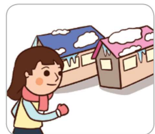
4 눈이 쌓인 지붕이나 고드름이 있는 곳은 접근하지 않는다.