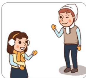
1 체온유지 용품(옷, 모자, 장갑, 신발 등)을 준비한다.