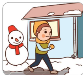
2 걸을 때 주머니에 손을 넣지 않는다.(낙상방지)