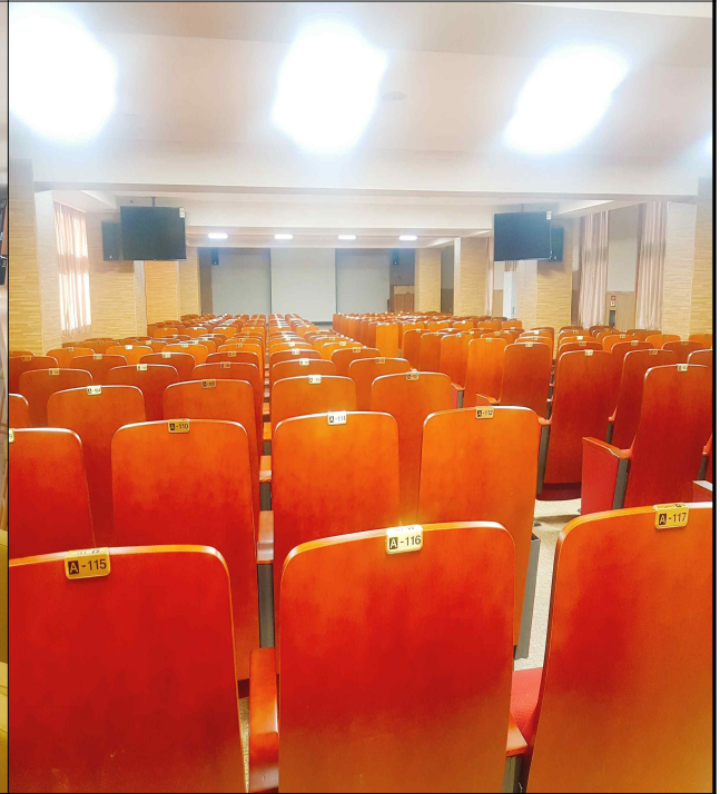
지 초 홀