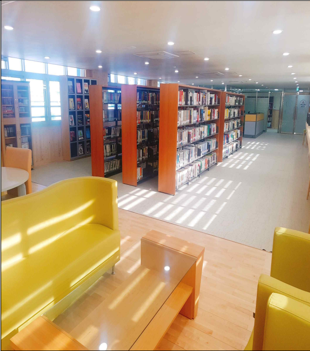
도 서 관