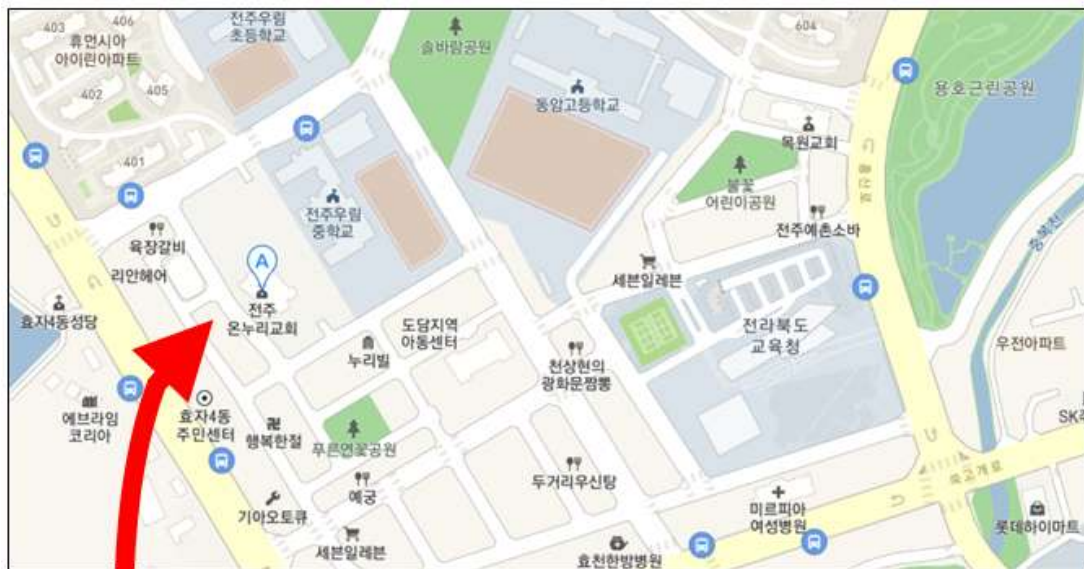
전주 온누리교회 주차장