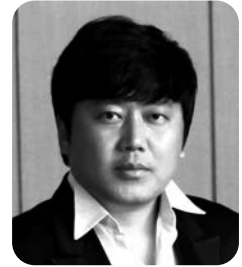
성 악 설 성 엽