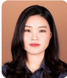
작곡/실용 이 현 아