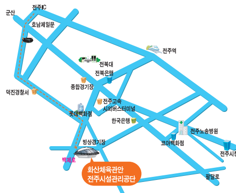
■ 화산체육관 ☎ 239-2577