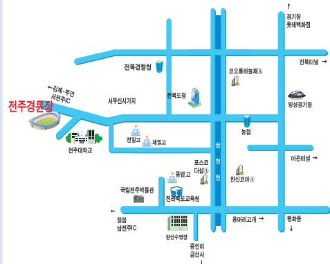
■ 전주경륜장 ☎ 239-2602