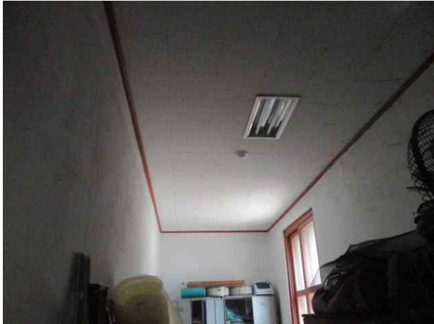
창고 천장재/텍스 유지관리