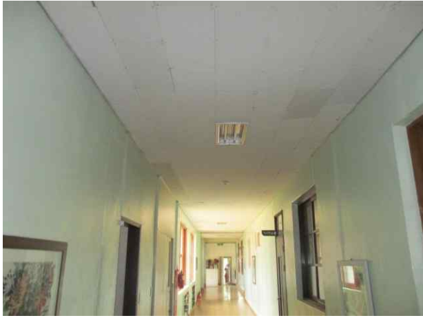
복도 천장재/텍스 유지관리