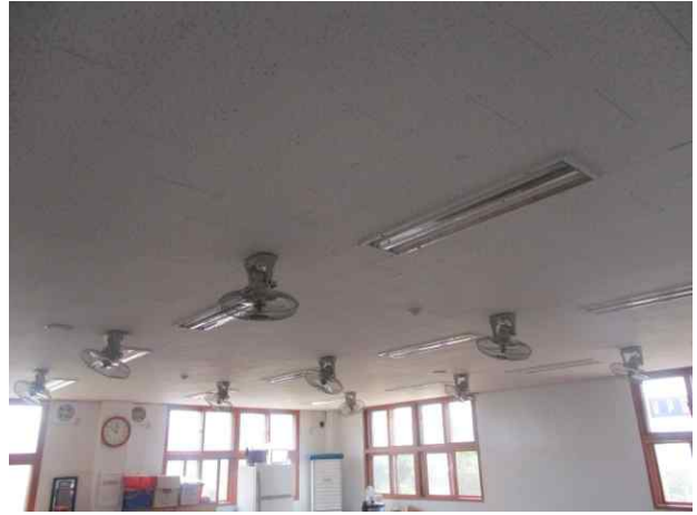
급식실 천장재/텍스 유지관리