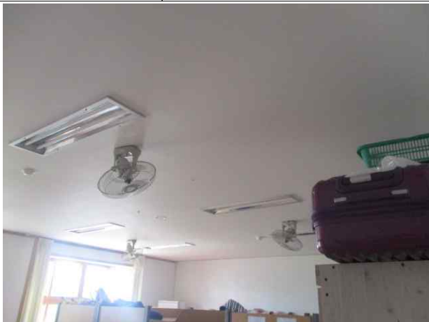
축구부휴게실2 천장재/텍스 유지관리