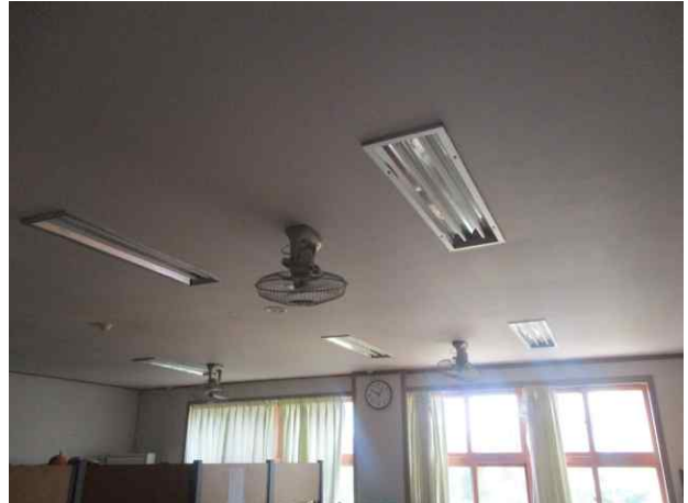
축구부휴게실1 천장재/텍스 유지관리