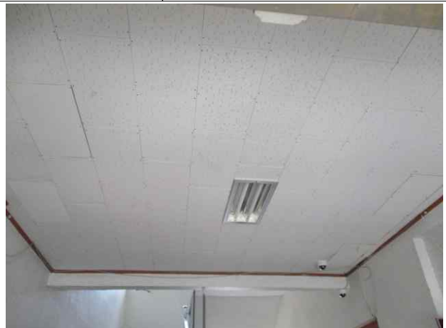
계단실 천장재/텍스 유지관리