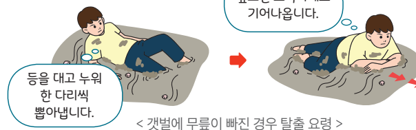
< 갯벌에 무릎이 빠진 경우 탈출 요령 >