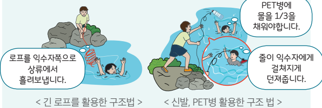
< 긴 로프를 활용한 구조법 > < 신발, PET병 활용한 구조 법 >