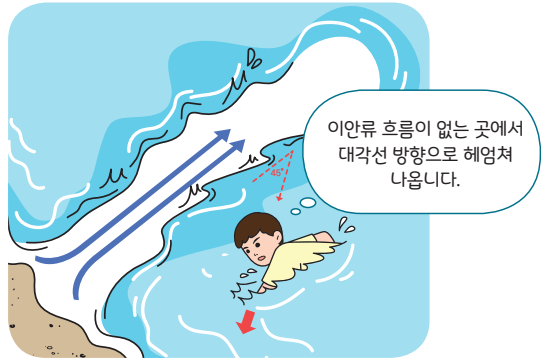
< 이안류 탈출 요령 >