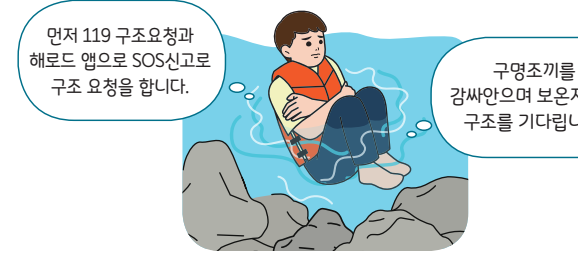
< 구조 전까지 체온유지(보온) 자세 >