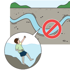
< 갯골에 접근 금지 >