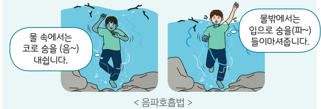
< 음파호흡법 >