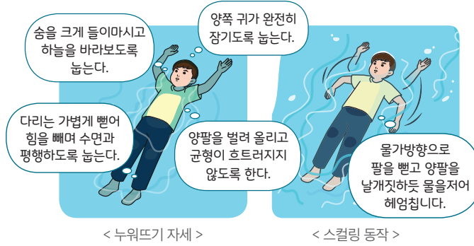
< 누워뜨기 자세 >