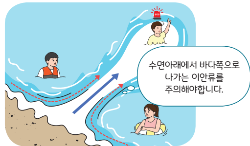
< 이안류(거꾸로 치는 파도) >

** 수면아래에서 바다 쪽으로 나가는 강한 역류성 흐름(최고 3m/sec).