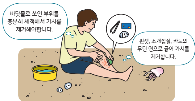
< 해파리에 쏘인 경우 대처요령 >