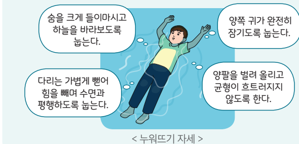
< 누워뜨기 자세 >