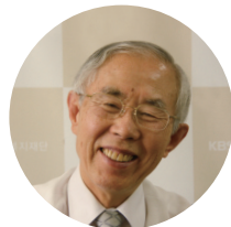
서울대학교 명예교수 손봉호