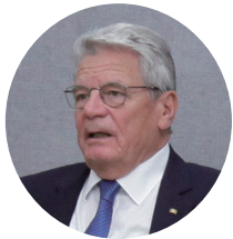
요아힘 가우크(Joachim Gauck) 독일연방 11대 대통령

여명학교는 북한이탈청소녀와 북한이탈주민자녀들의 남한사회적응을 도모하고 통일이후 사회통합을 위한 교육시스템을 구축할 것입니다