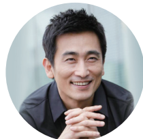
영화감독 겸 배우 차인표

여러분은 많은 고생을 하고 이곳에 왔는데 여명학교 학생들이 없었다면 우리 사회가 큰일 날 뻔했다는 그런 소리를 들을 수 있도록 학교와 함께 노력하시기 바랍니다. 지금껏 하나님이 여러분에게 주신 시련은 여러분을 훌륭한 사람으로 키우기 위함이라고 생각하고 노력을 아끼지 마시기 바랍니다.