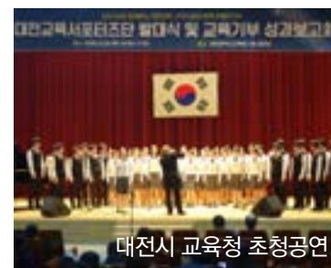
대전시 교육청 초청공연