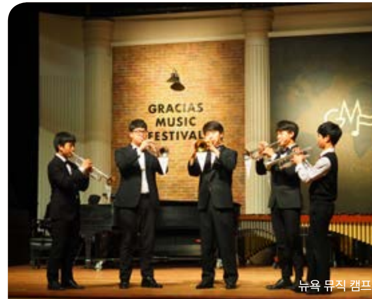
뉴욕 뮤직 캠프