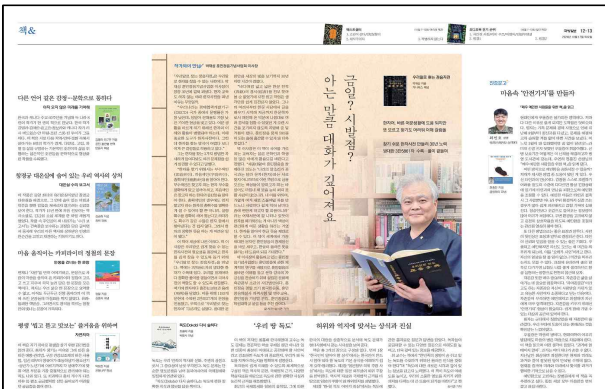
▲ 국방일보 특집 보도 후 주요 군부대 비치 도서