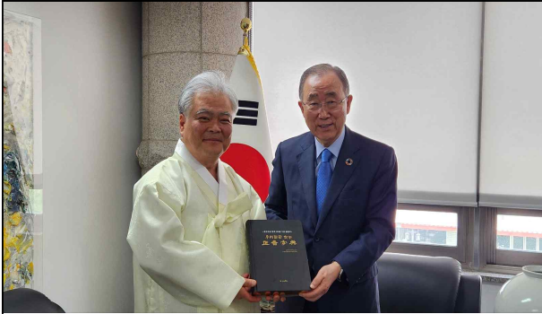
▲ 「보다 나은 미래를 위한 반기문 재단」 영구 소장