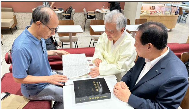
▲ 한글학회 회장 "이런 자전이 있다니 놀랍다."