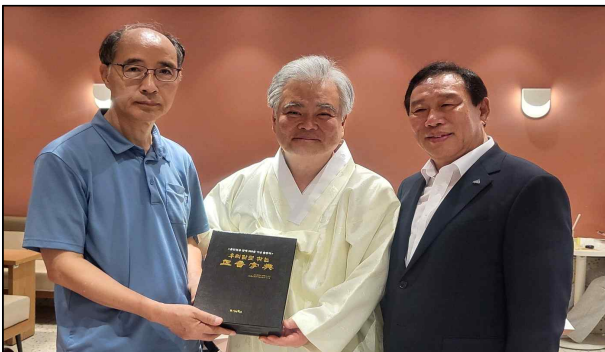
▲ 김주원 한글학회장(좌)과 최민호 세종시장(우)