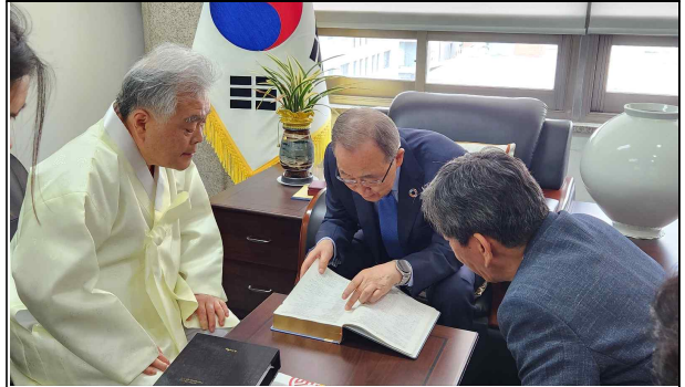
▲ 반기문 제8대 유엔사무총장이 극찬한 책