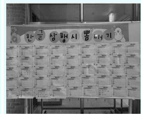
▲ 기념 행사 '한글 상행시 뽐내기'

경남 김해시에 김해한글박물관관장: 이통희는 광복 79주년을 맞아 8월 15일부터 18일까지 〈되찾은 나라,