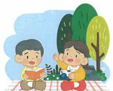
3 돛자리 사용하고