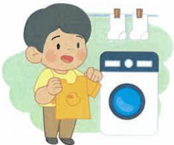
4 옷 털고, 세탁하고