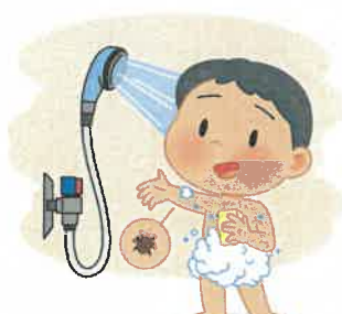
5 씻으며, 물린 흔적 찾아보고