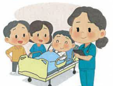
6 빨리 병원가서 치료받고