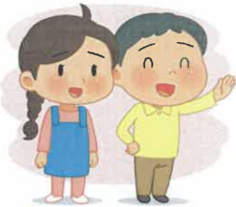
1 옷 제대로 입고