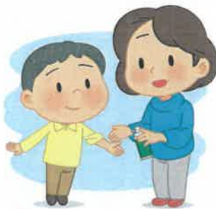
2 기피제 뿌리고