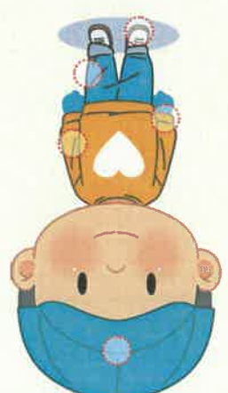
이름 '이름'의 '이름' (姓名)을