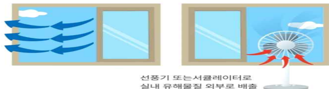
선풍기 또는 서큘레이터로 실내 유해물질 외부로 배출