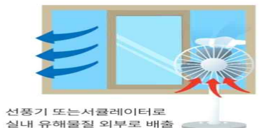
선풍기 또는 서큘레이터로 실내 유해물질 외부로 배출