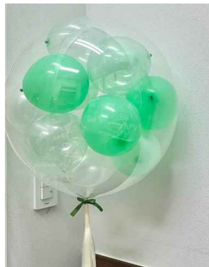
'기억의 풍선'을 읽고 나의 기억의 풍선을 이야기 나누고 만드는 독후 활동